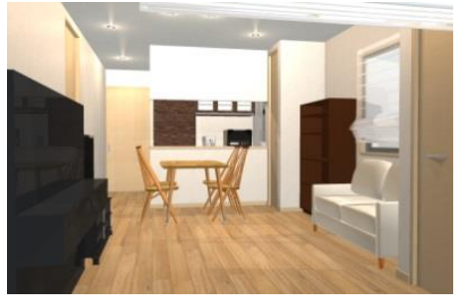
打ち合わせ時イメージパース