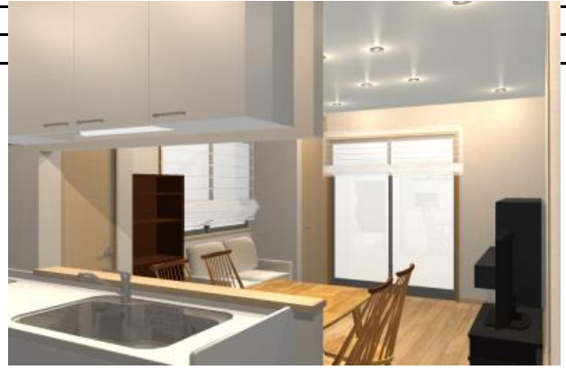
打ち合わせ時イメージパース