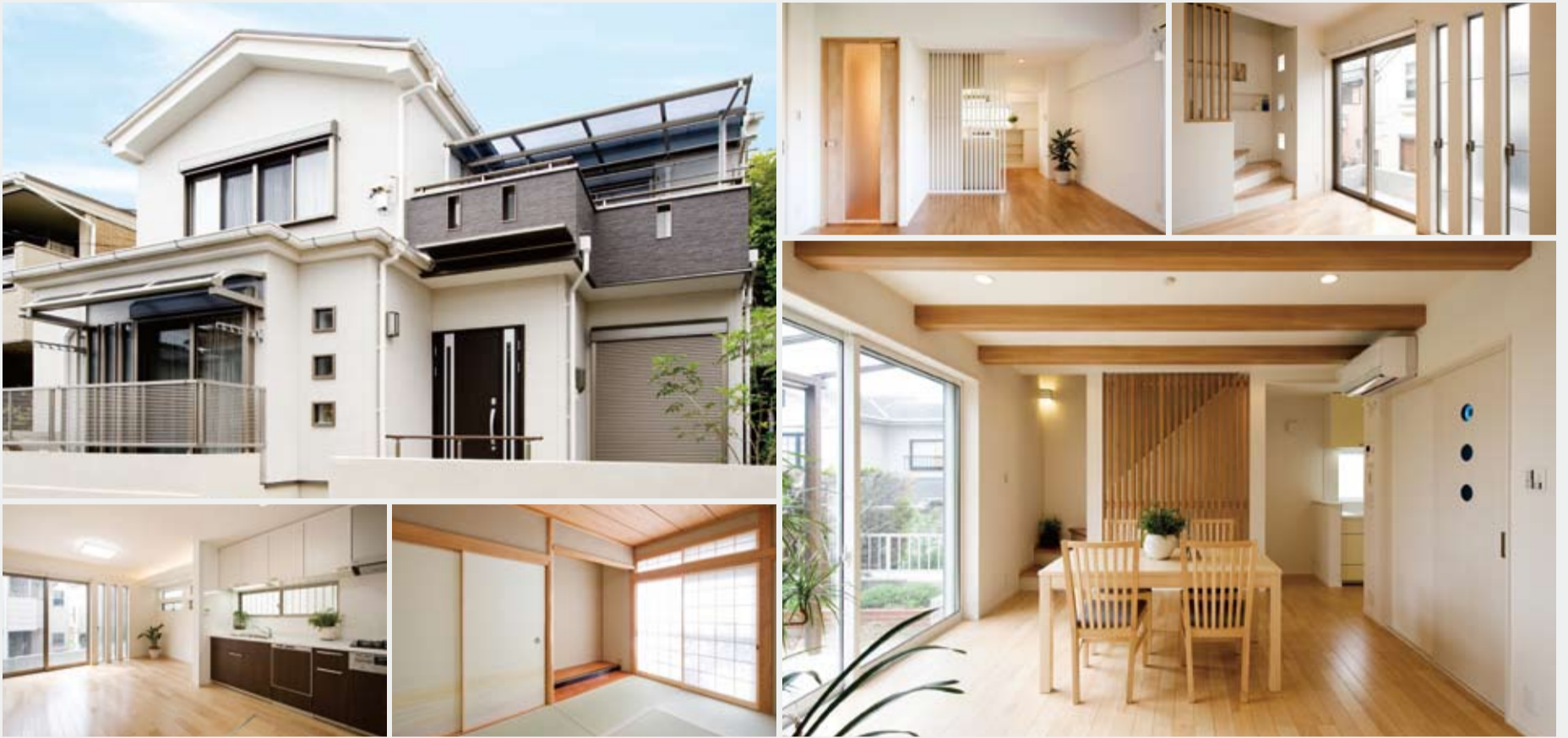
写真はすべて当社K-PACの施工例です

京阪電鉄不動産では、モデルハウスとしてお借りできるお家を探しています。 モデルハウス期間は3ヶ月から1年。 モデルハウスモニター様には特典がございます。 ※モデルハウスのため、キッチンや浴室等は使用いたしません。※空家でも大丈夫です。詳しくは係員にお尋ねください。