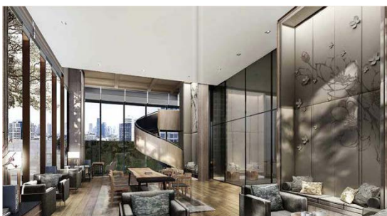
エントランスフロア (1F) ライブラリー