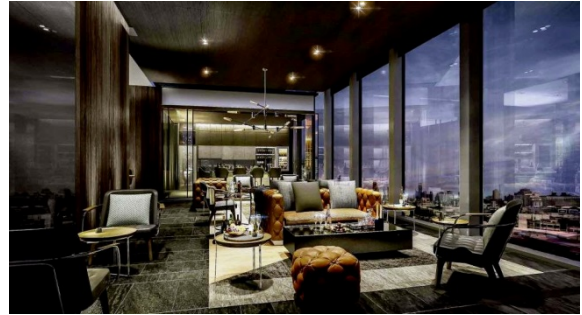
Fine Sky(31F) ワインラウンジ