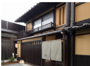
町家の面影を残した外観