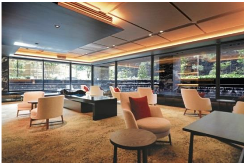
▲ラウンジより望む庭景

京都迎賓館の庭園思想を受け継ぎ、エントランスラウンジのガラス越しにはカスケード(小滝)を巡らし、水の表情や風にそよぐ緑葉などの“移ろいの景”と石灯籠や庭石、竹垣などの“不動の景”を調和させ飽きることのない庭景を創造しました。