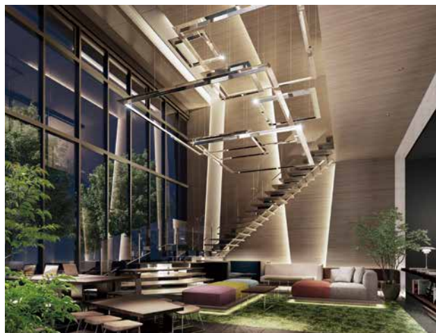
ラグジュアリーホテルのように優雅な共用空間（グランドラウンジ完成予想図）