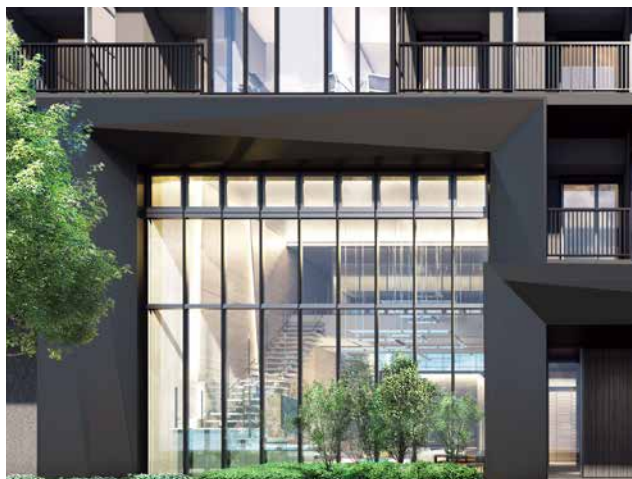
二層吹抜の大空間を覆うガラスが印象的なフォルム（外観完成予想図）