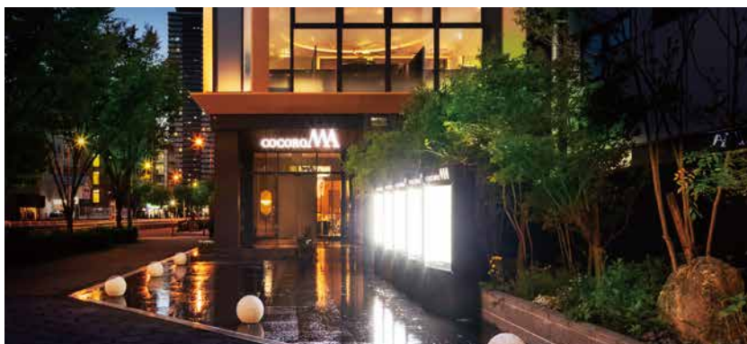
エントランスアプローチ