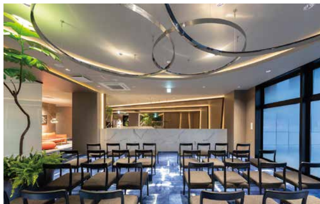
2F セミナースペース(定期的にセミナーを開催予定)