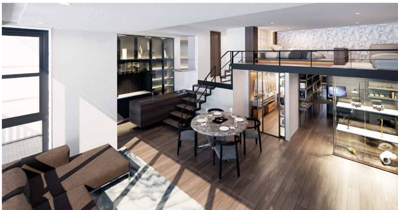
最大天井高3.55m※の、スキップフロアやロフトを設けた立体的で豊かな住空間（Qタイプ完成予想図）※一部タイプのみ