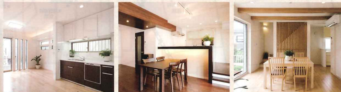
※写真は当社施工例です。今回の見学会とは異なります。

木造2F建ての全面再生です。 約延15坪の建物を以前1つにリフォーム されてきました。改めて、耐震補強工事を含め、 断熱等級もUP!!減築工事も行なって、明るく、 風通しの良い住まいに再生中です。