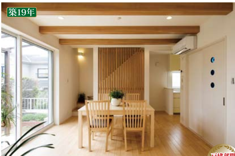
大阪の住まい力アップ 第1回リフォームリノベーションコンクール